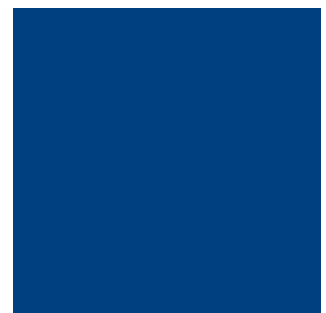
Quadrat en blau Com la resta de les actuacions de l'Associació/Col·legi va enquadrat en blau corporatiu.